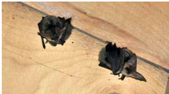
Sivi uhati netopirji v cerkvi Sv. Boštjana v Pečarovcih

Netopirji se na Goričkem čez dan zadržujejo v duplih debelejših dreves, v zvonikih in podstrešjih cerkva ali kapel, na podstrešjih opuščeni stavb, pod napušči hiš in v kletih ter na gradu Grad. Doslej je bilo na Goričkem popisanih 17 od 30 vrst netopirjev, ki živijo v Sloveniji. Iz svojih dnevni zatočišč izletavajo takoj po sončnem zahodu, ko je v zraku največ žuželk, s katerimi se prehranjujejo. Z raziskavami je bilo ugotovljeno, da netopirji, ki prebivajo v stavbah, osvetljenih z umetno svetlobo, izletavajo pozneje, saj dobijo napačno informacijo o naravni svetlobi in s tem o času dneva. S poznejšim izletavanjem netopirji zgrešijo višek aktivnosti žuželk v zraku, kar se pozna na prehranjenosti samic in mladičev. Zaradi motenj z umetno svetlobo lahko netopirji osvetljeno