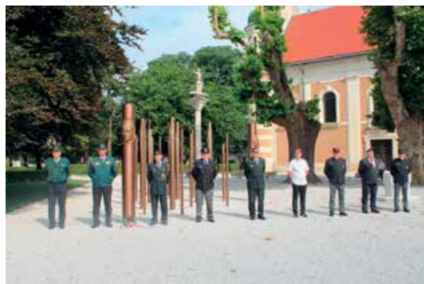
Praporščaki KODVOP-a pred spominskim obeležjem v Beltincih