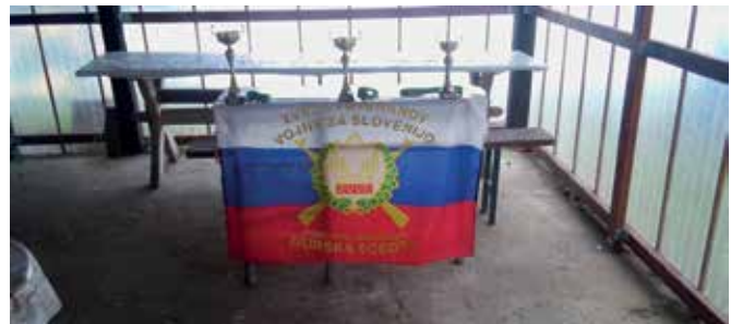
Ribiško tekmovanje – nagrade

Janez Kološa, O ZVVS Murska Sobota