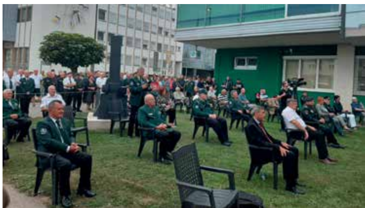
Delegacija O ZVVS Murska Sobota na slovesnosti v Murski Soboti