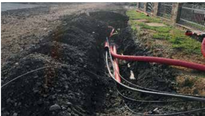
Polaganje elektro in telekomunikacijskega omrežja ter priprava vozišča v naselju Gorica