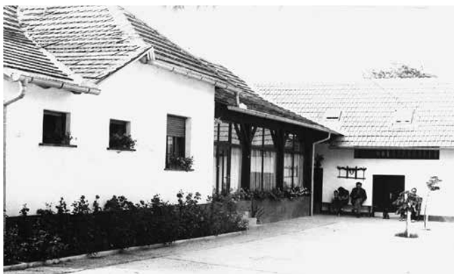
Domačija družine Tremel v Bokračih gre iz roda v rod. Vsaka generacija jo obnovi, ta slika je dokaj stara. Sedanja podoba je precej drugačna.