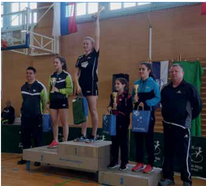
Državno prvenstvo v Komendi