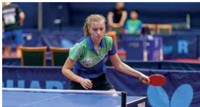
Mednarodno prvenstvo Slovenije

S soigralkami matičnega kluba, NTK Kema Puconci, tekmujemo v 1. Slovenski namiznoteniški ligi, kjer nas ob športu in tekmovanju, povezuje tudi prijateljstvo v prostem času.