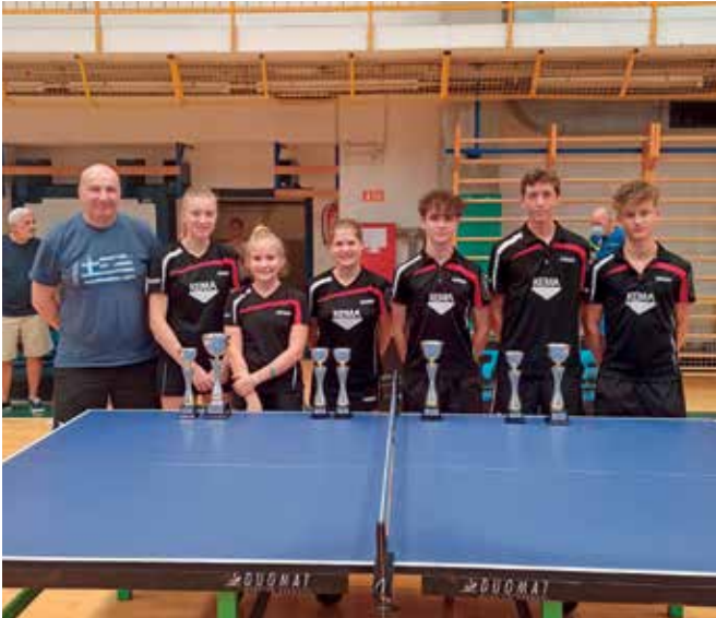
Mladinsko DP v Izoli

sta se v kategoriji mešanih parov uvrstila v polfinale in osvojila bronasto medaljo.