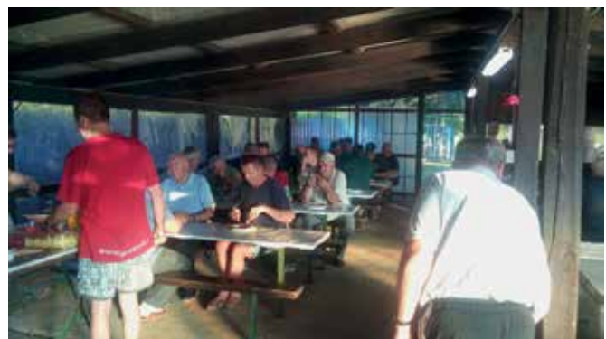
Obisk visokih gostov

Janez Kološa, O ZVVS Murska Sobota