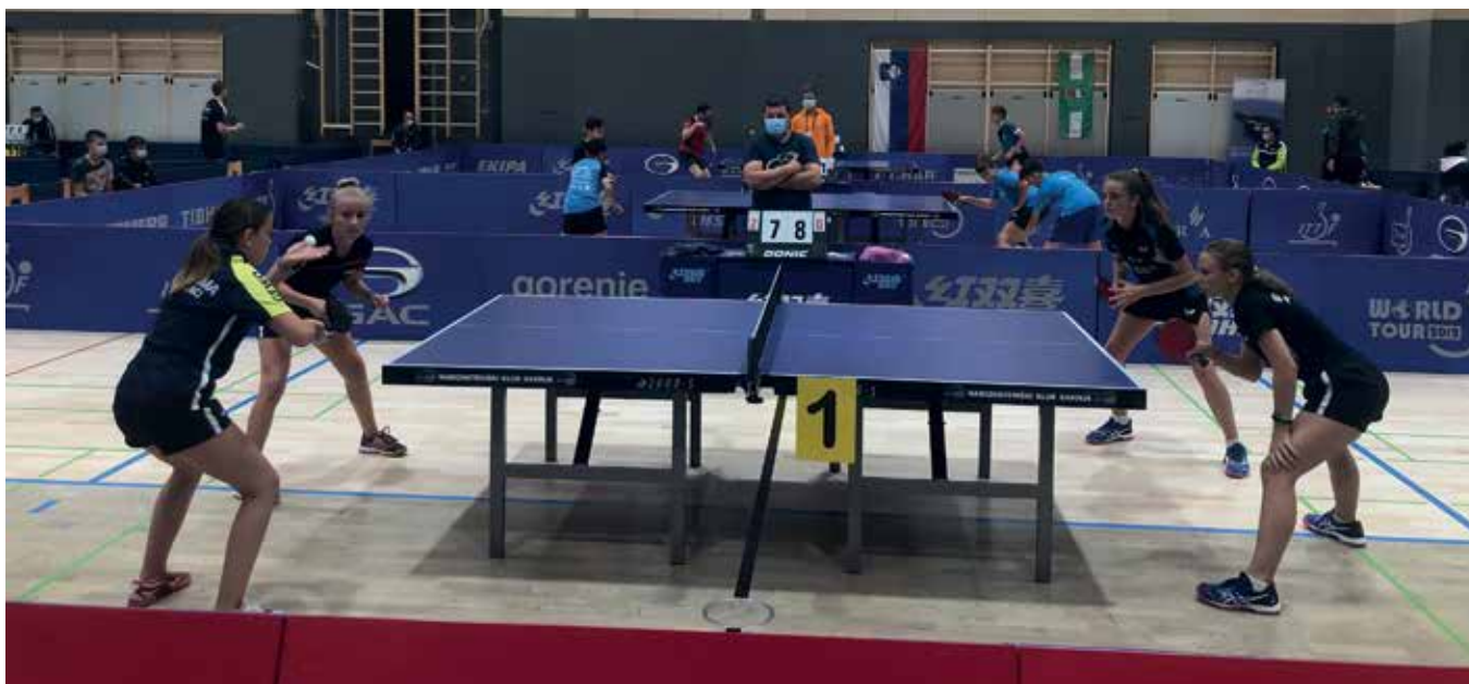
Finale dvojic mlajše kadetinja

klubov, pri U21 pa jih je tekmovalo le 64. Med njimi so bili tudi klubi iz Pomurja (Kema – 11, Sobota – 6 in Ljutomer – 1). Med njimi so največ uspeha dosegli člani NTK Kema, saj so osvojili državni naslov in drugo mesto v dvojicah U13.