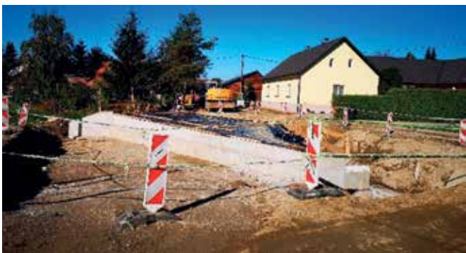
Izvedba mostu in kamnitega zidu ob potoku v naselju Brezovci

Izvajalec del je bil dne 3. 7. 2020 uveden v delo in se šteje tudi kot datum pričetka del in mora dela opraviti v roku 360 dni, tj. do konca junija 2021.