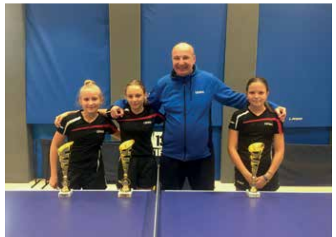
Nosilke naslovov DP mlajših kadetinj s trenerjem

Minuli vikend sta bili v Lučah še zadnji državni prvenstvi, in sicer za mlajše kadete/kadetinje (U13) in člane/članice do 21. let. V mlajši kategoriji je bilo prijavljenih kar 116 igralcev in igralk iz 24 slovenskih