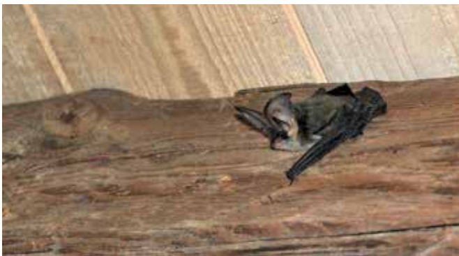
Sivi uhati netopir

bolka in hruške. Strokovnjaki za netopirje ocenjujejo, da netopirji s plenjenjem žuželk kmetom v Severni Ameriki prihranijo do 53 milijard dolarjev na leto, ki bi jih sicer porabili za fitofarmacevtska sredstva proti t.i. škodljivcem na poljščinah.